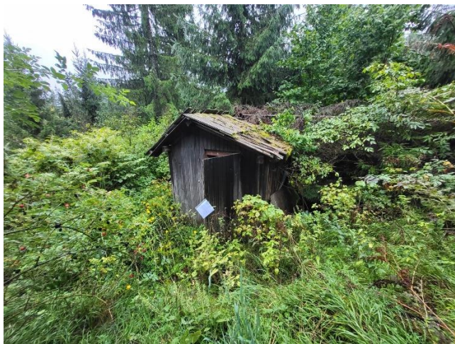
Objekt z ID št. 902-267