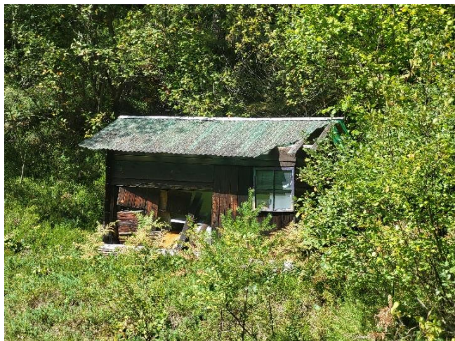
Objekt z ID št. 900-218